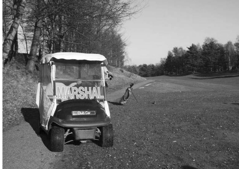
De marshal houdt een oogje in het zeil.

bestuur en de BV uitgegeven richtlijnen (zorg voor de baan, voorangsregels, juist gebruik trolleys en buggy's etc);