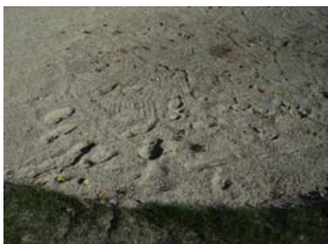
Niet aangeharkte bunker. Een doodzonde in golf.

8 Volg de aanwijzingen van de geplaatste borden en zoek niet uw eigen weg