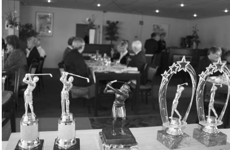
De Sint en zijn Pieten spreken de senioren toe. Foto boven: de trofeeën wachten op de jaarwinnaars.

Als goedheiligman benadrukte de Sint vanzelfsprekend