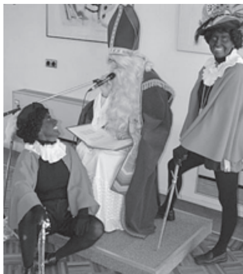
Sinterklaas op visite bij de SeCo en bij de winnaars van het tweede half jaar.