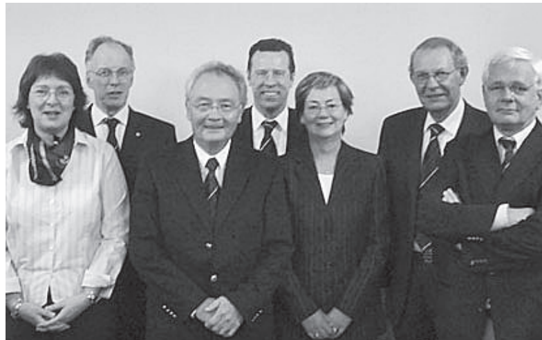
Het bestuur kende een druk jaar en zette veel in gang.

Om enkele redenen heeft slechts een zeer beperkt aantal leden gebruik kunnen maken van de nieuwe 9. Met de exploitant is overeengekomen dat nu de periode tot medio 2006 als proefperiode zal worden gebruikt. Nadere details