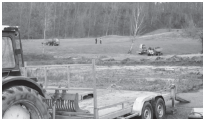
De werkzaamheden tussen parkeerplaats en Rood 2 zijn begonnen. Op deze plek verrijst straks de nieuwe materiaalloods.

Tijdens de wintermaanden, indien het weer het toelaat, zal begonnen worden met de renovatie van de bunkers op course rood. Tevens zal de beregeningsleiding op hole 2 course rood worden vernieuwd. Daarmee hopen we de lekkages op de hole te hebben opgelost.